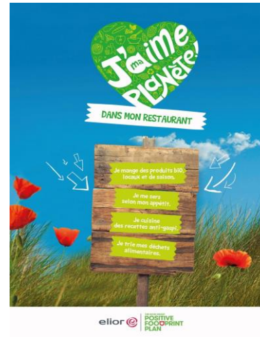
Résultat final - DEFI ANTI GASPI 2023/2024

Si le défi est réussi les collèges remportent un atelier de cuisine sur le thème « régaler vous plutôt que gaspiller »